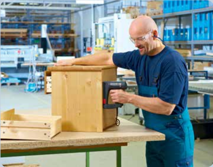
Schnelles Nageln von z.B. Möbelrückwänden mit dem Tacker.