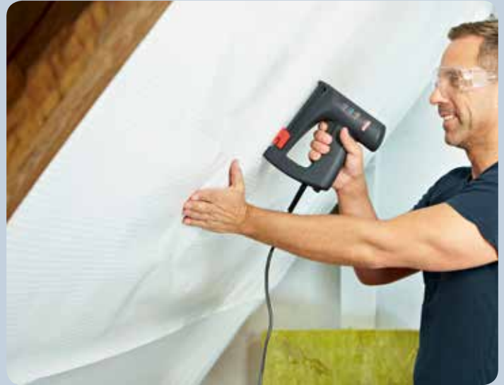
Folie beim Dachbodenausbau einfach befestigen.