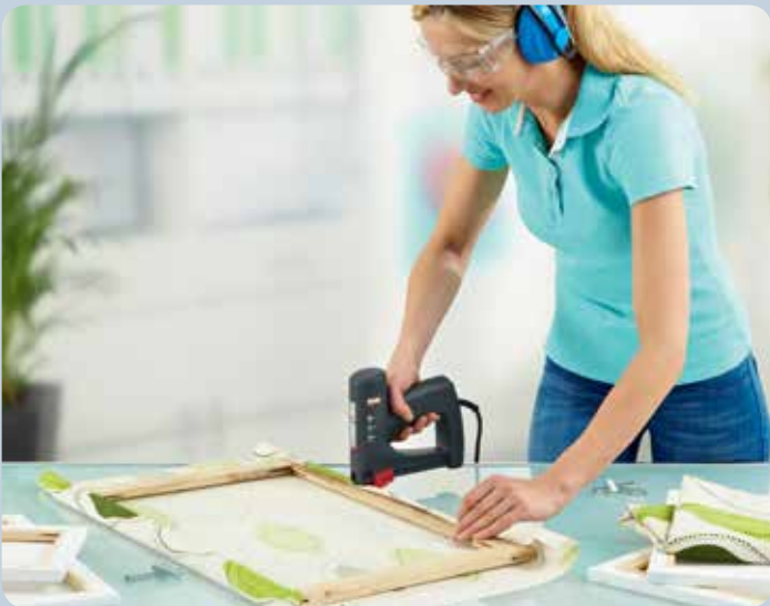
Schnelles Bespannen von Bilderrahmen.