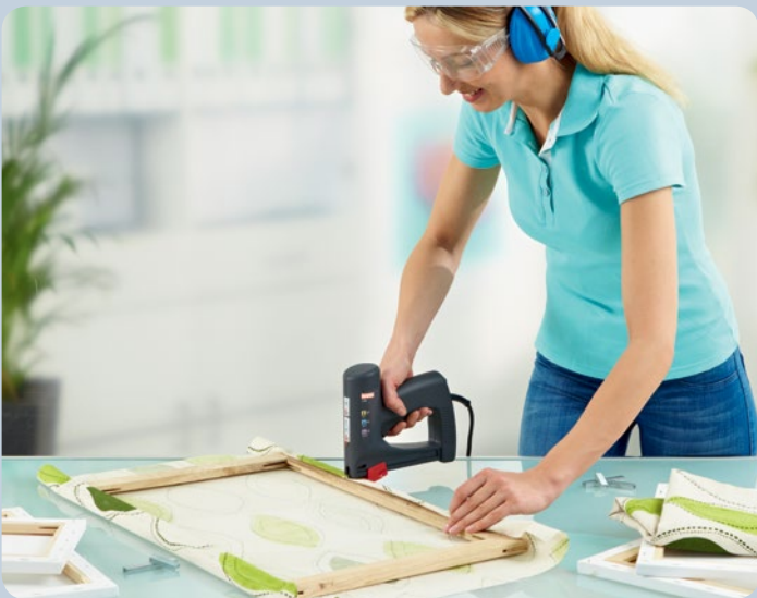
Acondicionamiento rápido de marcos para cuadros.