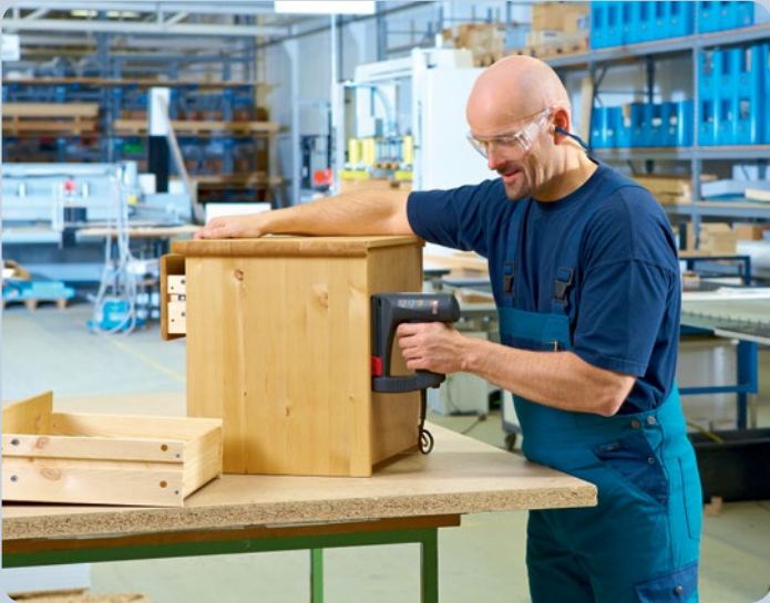
Clavado rápido, por ejemplo, de paredes posteriores de muebles con la grapadora.