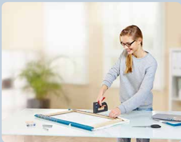
Tension rapide des cadres.