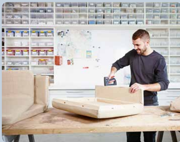
Réaliser tout simplement des travaux de capitonnage avec l'agrafeuse.