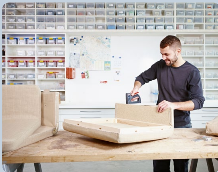
Réaliser tout simplement des travaux de capitonnage avec l'agrafeuse.