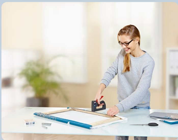
Tension rapide des cadres.