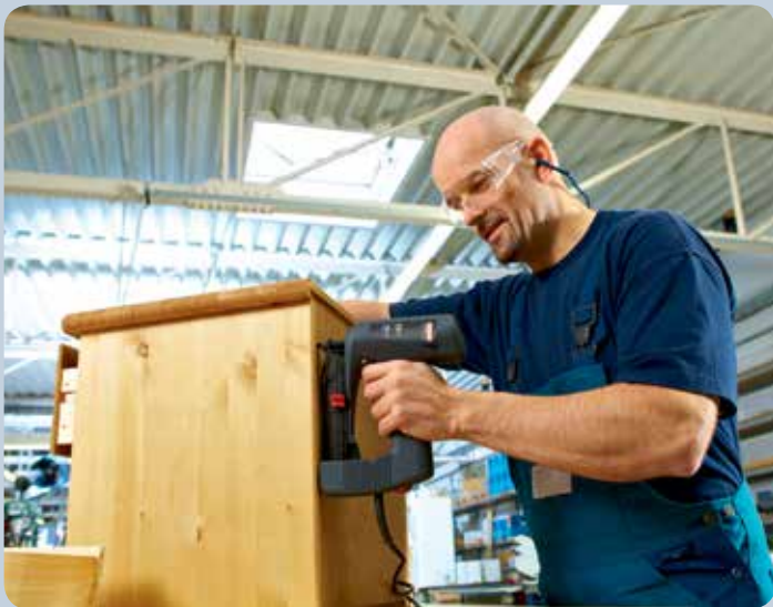
Schnelles Nageln von z.B. Möbelrückwänden mit dem Tacker.