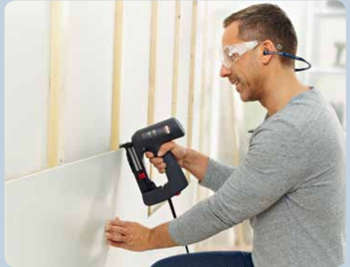
Fixer des bois profilés avec des clips en bois profilé.