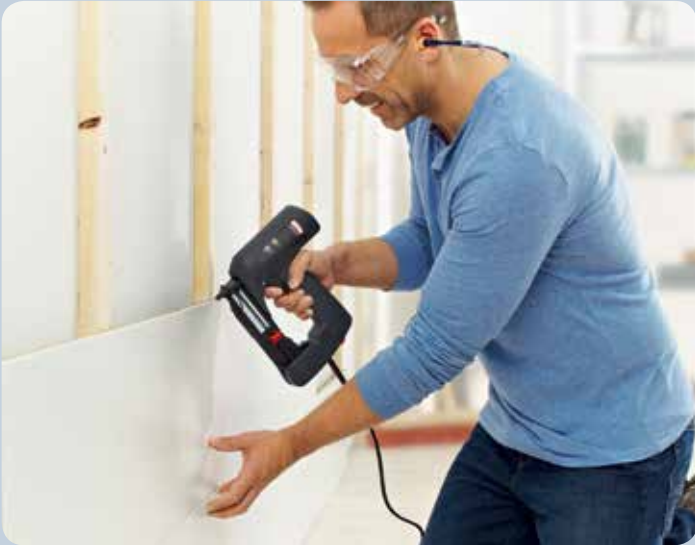
Cette agrafeuse est en métal.