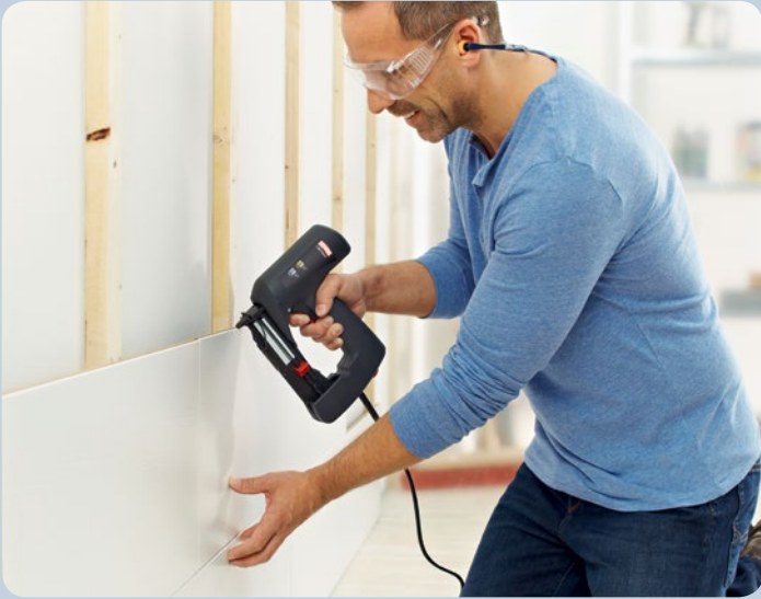
Cette agrafeuse est en métal.