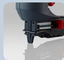
K/12 Le « bec » de forme étroite et longue de l'agrafeuse permet un travail précis même aux endroits difficilement accessibles.