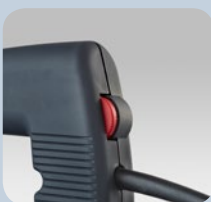
Réglage de la puissance de frappe G type 11