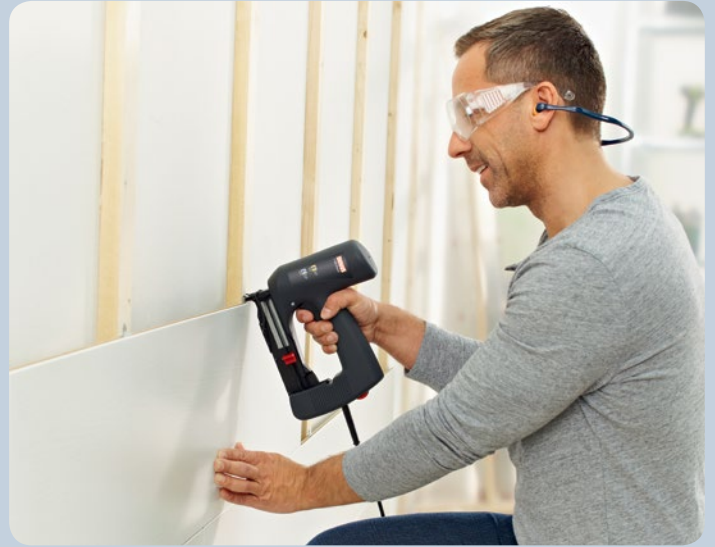
Fixer des bois profilés avec des clips en bois profilé.