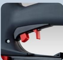
Sécurité de déclenchement L'agrafeuse ne peut être utilisée que lorsque la sécurité de déclenchement est rabattue.