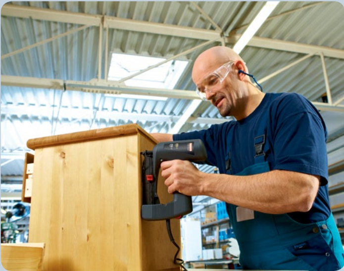
Clouage rapide par ex. des parois arrière de meubles avec l'agrafeuse.