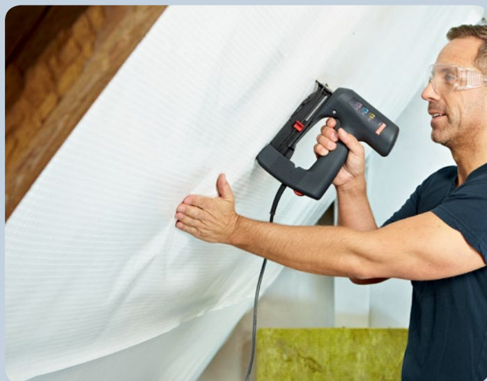
Fijación sencilla de láminas en trabajos de ampliación de áticos.