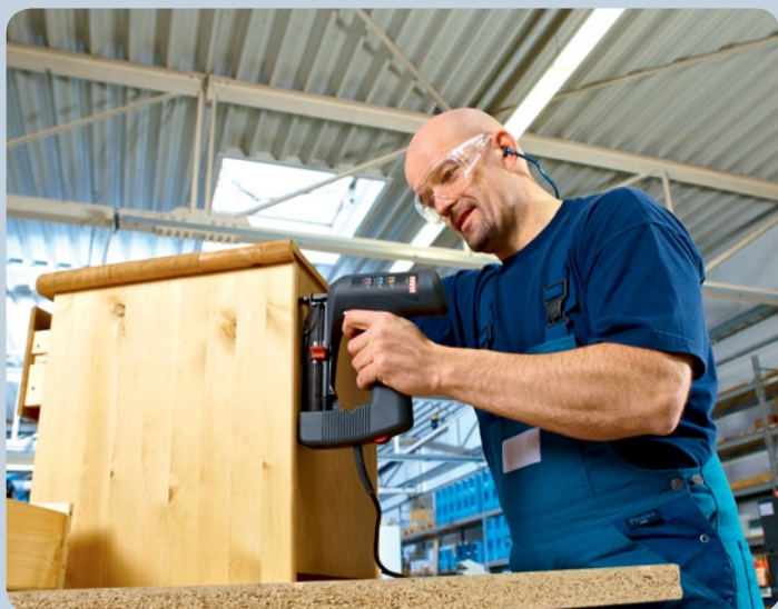
Clavado rápido, por ejemplo, de paredes posteriores de muebles con la grapadora.