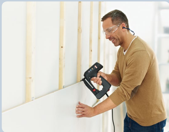
Fijar perfiles de madera con las respectivas garras.