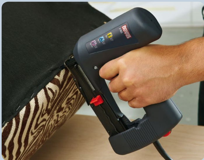
Realizar trabajos de tapicería muy fácilmente con la grapadora.