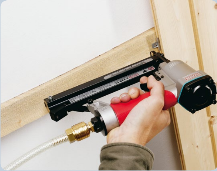
Profilhölzer mit Profilholzkralen befestigen.