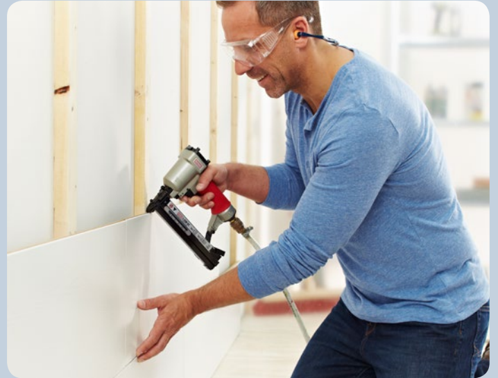
Direktes Befestigen von Profilhölzern.