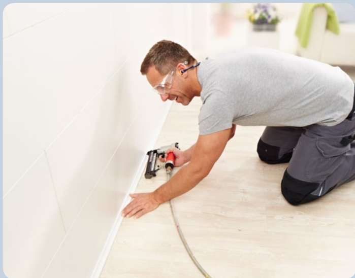
Las molduras decorativas pueden fijarse con grapas de manera rápida y sencilla.