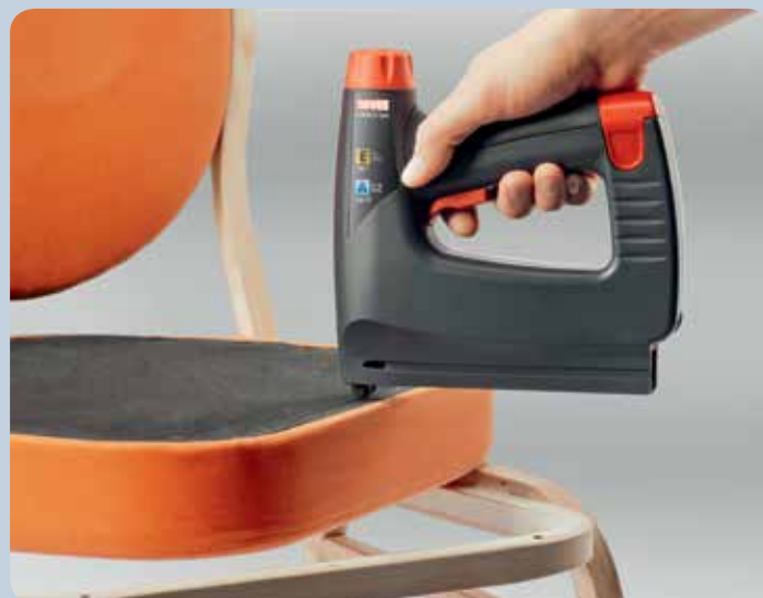
Réaliser tout simplement des travaux de capitonnage avec l'agrafeuse.