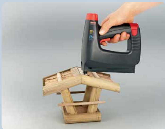
Une fixation rapide : le clouage