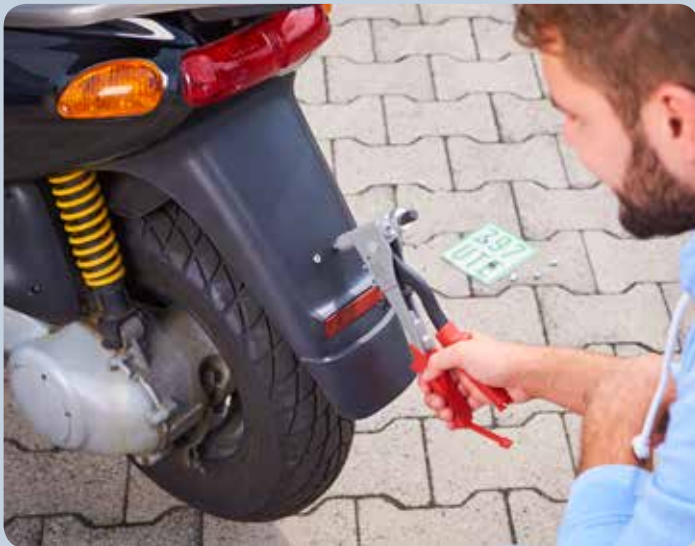
Les plaques d'immatriculation peuvent être remplacées en toute facilité par le filetage dans l'écrou à river.