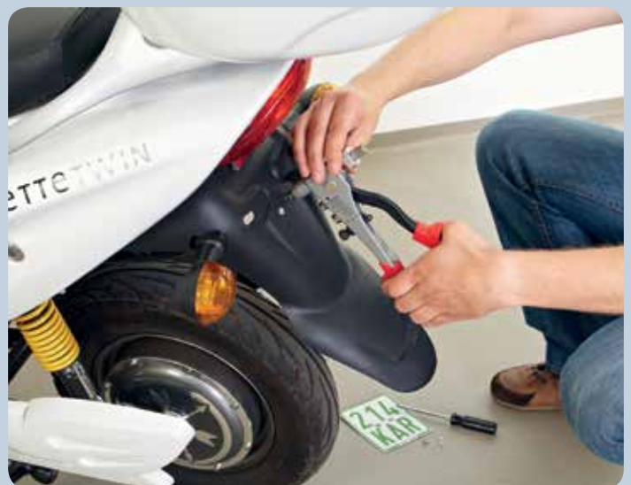
Les plaques d'immatriculation peuvent être remplacées en toute facilité par le filetage dans l'écrou à river.