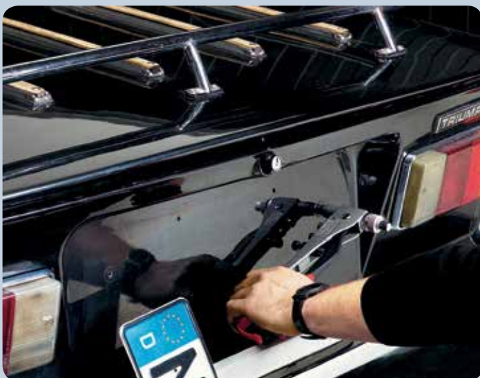
Les plaques d'immatriculation peuvent être remplacées en toute facilité par le filetage dans l'écrou à river.