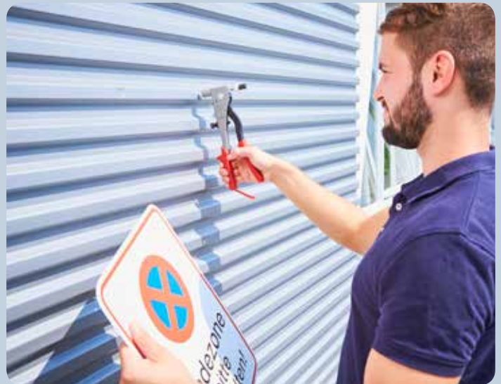
Le filetage prévu dans l'écrou à river permet le vissage d'une plaque même si son dos n'est pas accessible.