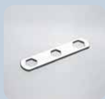
Clé de montage Panneaux de fibres minérales