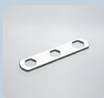
Clé de montage Panneaux de fibres minérales