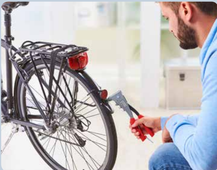
Fijar chapas de protección