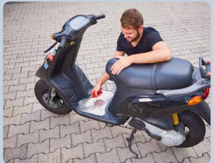
Incluso cuando se usan materiales firmes como el aluminio, el remachado tampoco representa un problema.