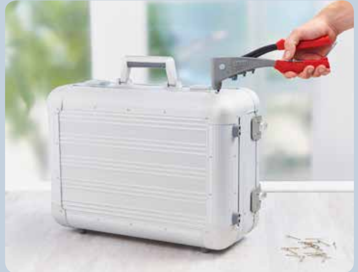
Incluso cuando se usan materiales firmes como el aluminio, el remachado tampoco representa un problema.