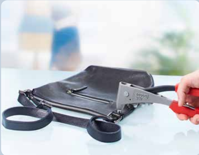
Las asas de las carteras pueden volver a fijarse rápidamente.