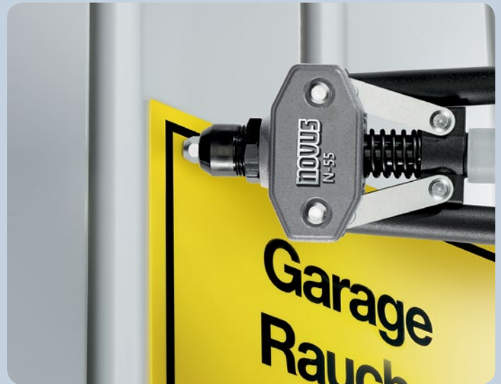
Schilder können auf unterschiedlichsten Untergründen sicher befestigt werden.