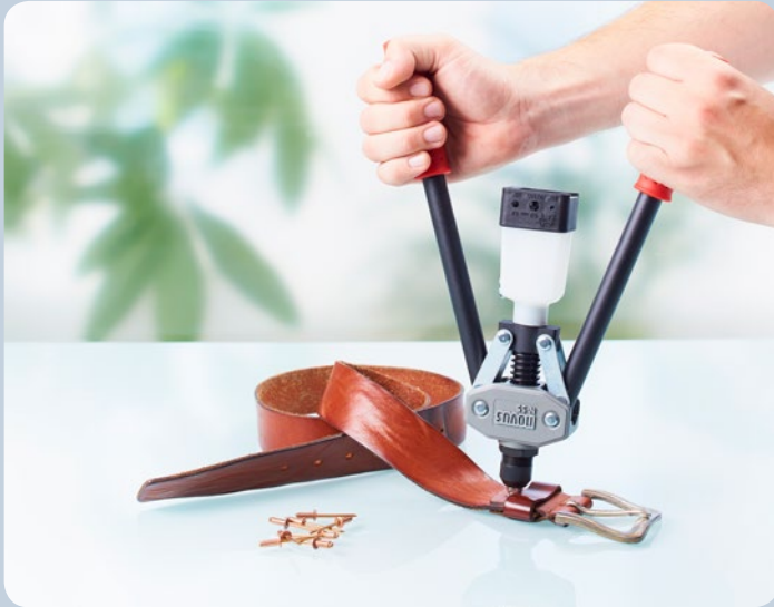
Kleine Reparaturen an Ledermaterialien sind schnell erledigt.