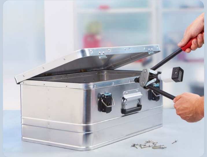
Selbst bei festen Materialien wie Aluminium ist Nieten kein Problem.