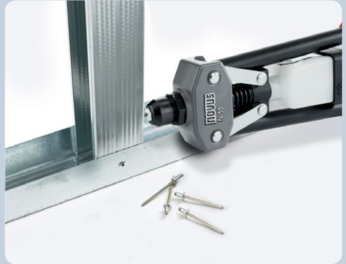
Selbst bei festen Materialien wie Aluminium ist Nieten kein Problem.