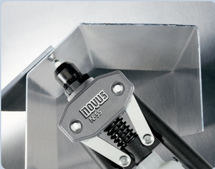
Optimal geeignet zur Befestigung Stahlblechen.