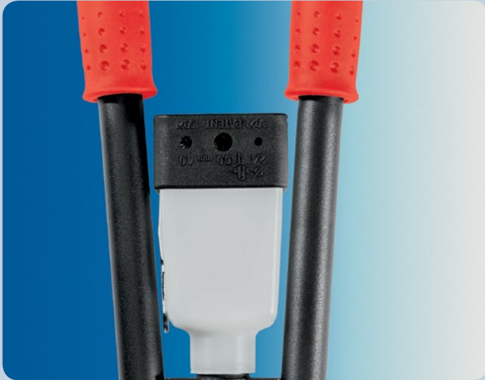
Kleine Reparaturen an Ledermaterialien sind schnell erledigt.