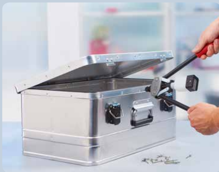
Le rivetage ne pose aucun problème même en cas de matériaux durs tels que l'aluminium.