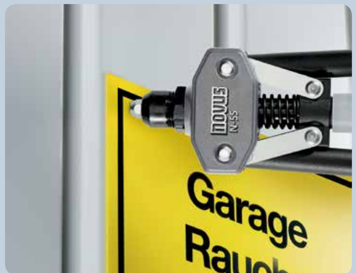
Les panneaux peuvent être parfaitement fixés sur les supports les plus divers.