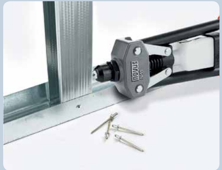
Le rivetage ne pose aucun problème même en cas de matériaux durs tels que l'aluminium.