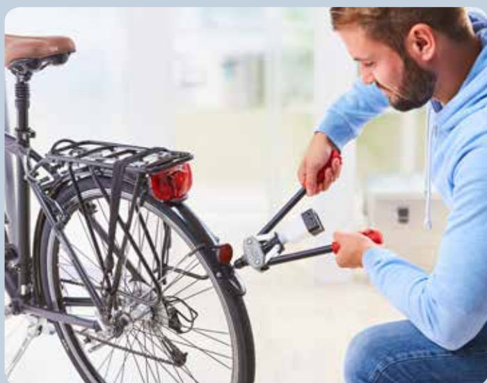
Fixation de tôles de protection