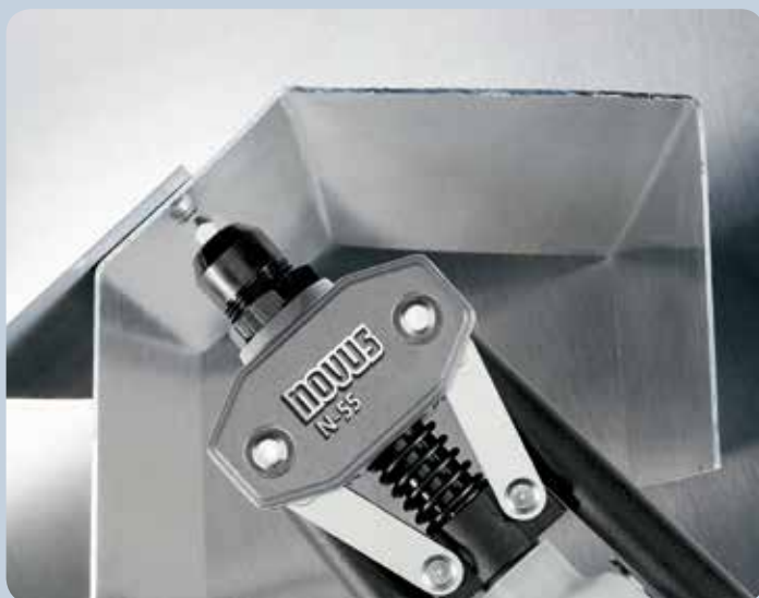
Convient parfaitement à la fixation de tôles d'acier.